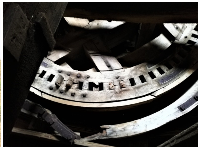
Hathjulet blev voltsomt skader for mange år siden

Først besøgte vi Karrebæk Mølle og efter en kaffepause, fik vi en orientering og grundig rundvisning af nogle af møllelaugets medlemmer. Møllelauget ejer møllen, der er fredet. Møllen har ikke fungeret i mange år, men møllelauget har lagt en plan for etapevis restaurering over en årrække fremover.