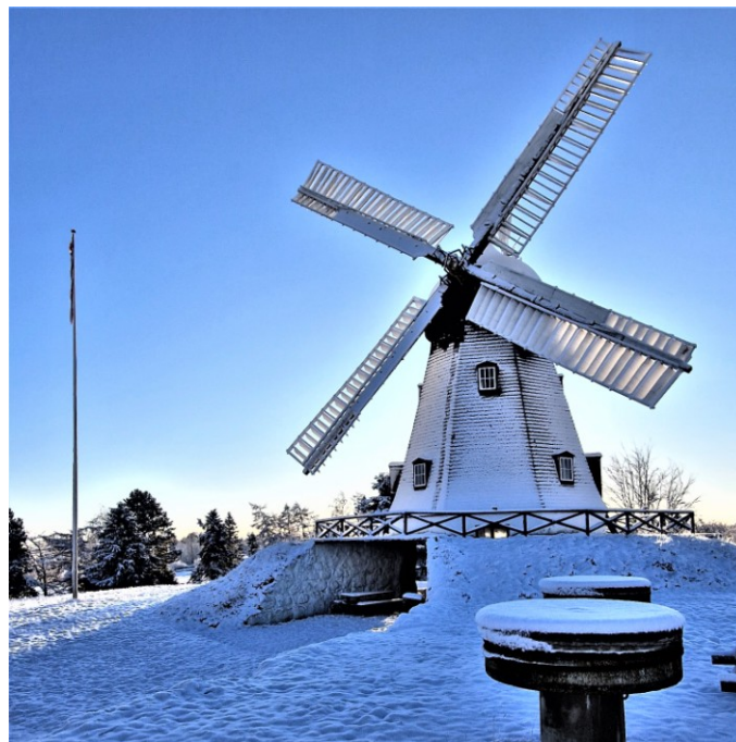
Højsager Mølle 8.december