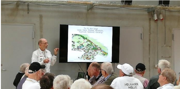
Oplæg fra Frilandsmuseets møllerlaug

Efter et kort oplæg, var der tur rundt til museets møller. Der er 3 vindmøller og 4 vandmøller på museet.