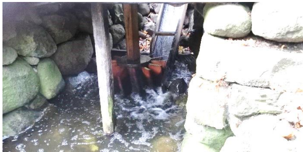
Den lille "skvatmølle" fra Læsø