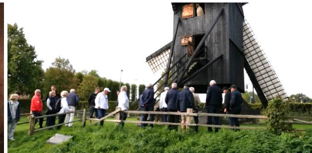
Kalstrup stubmølles seneste restaurering studeres.