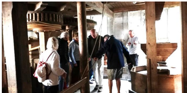
Inde i Ellested Vandmølle