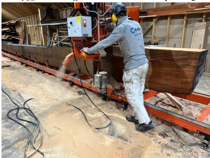
Tilskæring af vingearmene sker med en voksen sav