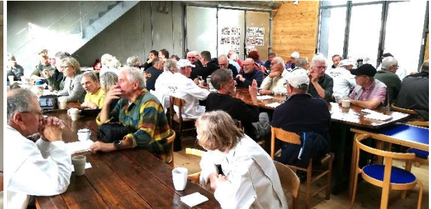
Et udsnit af forsamlingen