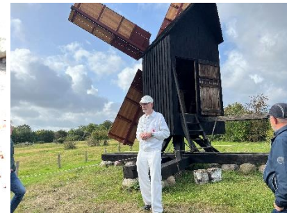
Møllerlaugets oldemand fortæller

Efter en god frokost var der erfaringsudveksling, hvor der bl.a. blev drøftet: