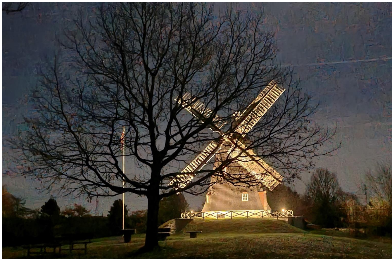
Højsager Mølle bag grundlovsegen, 14.nov. 2024 kl. 20:52

Belysningen af møllen i de mørke aftentimer er blevet rost fra mange sider. Grundlovs-egen har kastet alle sine blade, og kan derfor ikke afskærme kikket til møllen.