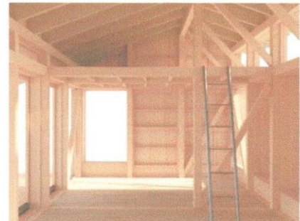
Rummet før skabe og borde

Alt holdes i afdæmpede farver, der passer godt ind i omgivelserne, Der bruges mange genbrugsmaterialer i god kvalitet til alle Realdanias huse.