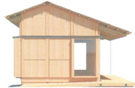
Der er kørerampe og træterrasse