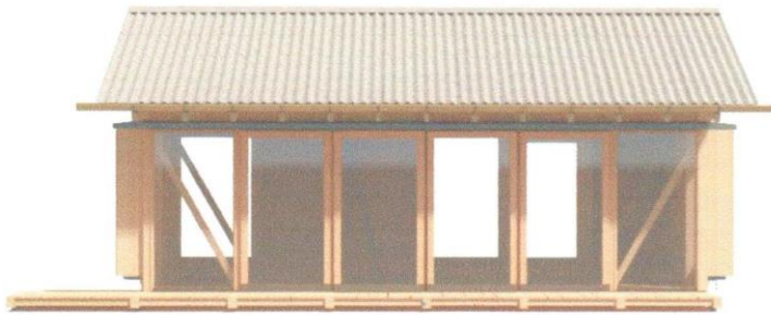
En åben facade med gennemsigtige skydedøre

Lidt billeder, der kan give et indtryk af, hvordan den nye bygning kommer til at se ud: