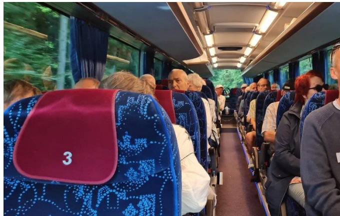
Turen kunne nydes i perfekt sommervejrl hele dagen

Turen rundt til "anderledes Nordsjællandske møller," lørdag den 27.juli, foregik i en moderne bus med plads til os alle. Der var tilmeldt 37 deltagere, 3 meldte afbud pga. sygdom.