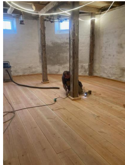
Samme rum 18.november 2023 og 17.maj 2024

Møllen er nu netop blevet frilagt fra de magasinbygninger, den var blevet bygget sammen men, så nu er der plads til, at vingerne kan krøje helt rundt.