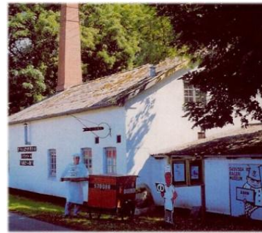
bageren ved bagerimuseet

I år går turen til to møller i det sydvestlige hjørne af Sjælland, nemlig Kanehøj Mølle nær Skelskør hvor der bl.a. er "Søndags – Majs-labyrinth" og Skovsgaards Mølle- og bagerimuseum mellem Næstved og Slagelse med en meget stor samling bl.a. af håndværktøj, maskiner, brødvogne og kaner. Forskellige årsager har gjort, at dette års tur falder lidt sent, men vi håber på godt vejr alligevel.