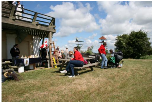
møllelag ved Kanehøj Mølle

Tilmelding sker ved indbetaling af deltagerbeløbet til konto 2415 - 6276 712 916 senest den 31. august. Husk tydelig(e) navn(e) Nærmere program udsendes ultimo august.