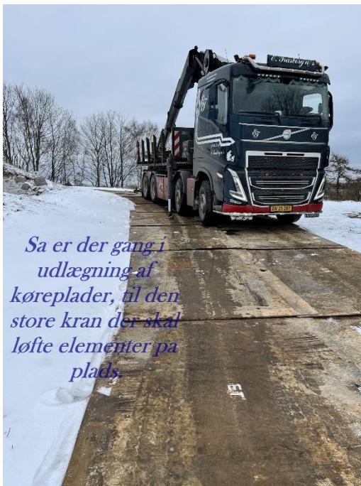
Så er der gang i udlægning af køreplader, til den store kran der skal løfte elementer på plads.

Byggearealet blev indhegnet, men så kom "kong vinter" lige forbi, -så blev billedet i sandhed frosset.