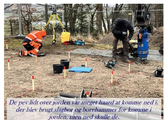
De bev lidt over jorden var meget haard at komme ned i, der blev brugt slagbor og borehammer for komme i jorden, men ned skulle de.

Først efter omkring 3 ugers pause, gik arbejdet for alvor i gang