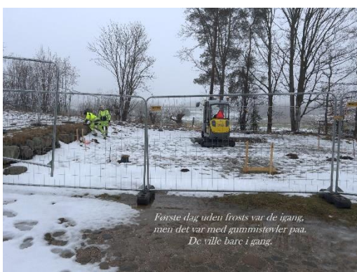
Første dag uden frosts var de igang, men det var med gummistøvler på. De ville bare i gang.

Først efter omkring 3 ugers pause, gik arbejdet for alvor i gang