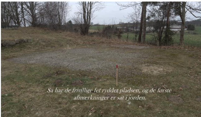
Så har de frivillige fået ryddet pladsen, og de første afmærkninger er sat i jorden.

Frivilliggruppen fik torsdag den 27.januar flyttet bord-bænkesættene op på møllebakken og gjort arealet klart til byggeplads.