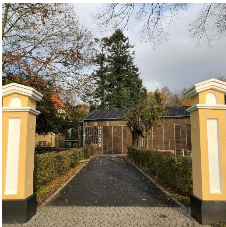
Egedal Byens Hus

Selv om vi er i lidt god tid, kan vi dog fortælle, at generalforsamlingen vil blive afholdt onsdag den 9.april i Egedal, Byens Hus i Kokkedal. Nærmere vil blive udsendt i marts måned.