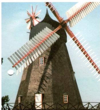
Højsagervej 8, 3480 Fredensborg

Højsager Mølle, blev bygget i 1870. Den blev fredet i 1959, men var i drift til 1972.