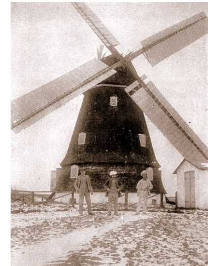
ca 1915