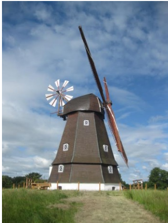
Karlebo Molen, Kirkeltevej 161C, 2980 Kokkedal

Sinds de middeleeuwen zijn er verschillende vormen van malen in Kokkedal. De huidige molen dateert uit 1835 en is gebouwd op de plaats van een afgebrande stompmolen.